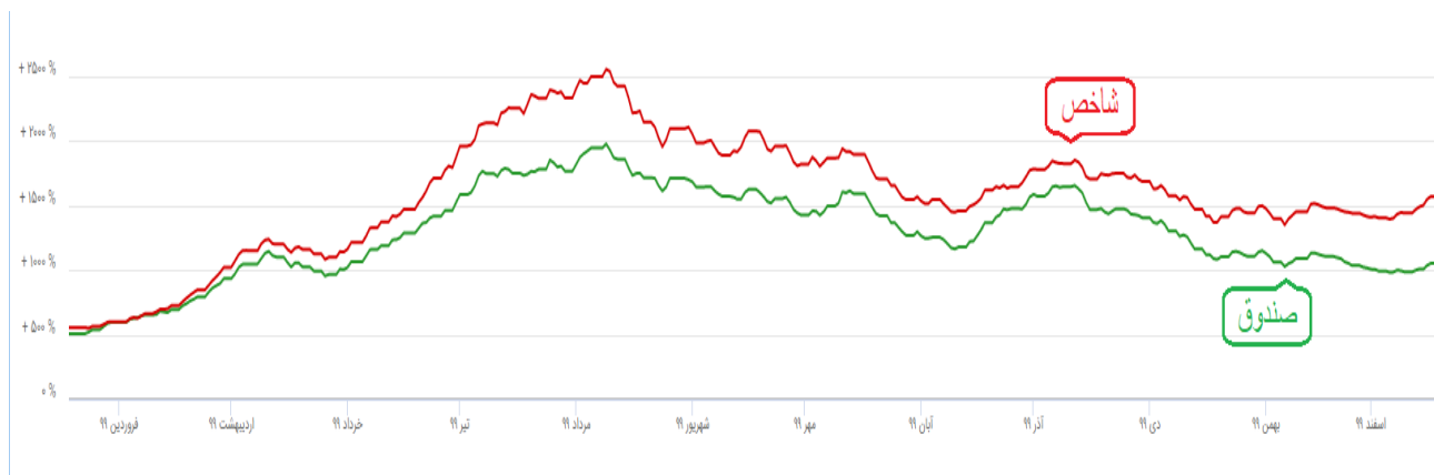
۷-مقایسه بازده صندوق با بازده شاخص کل بورس